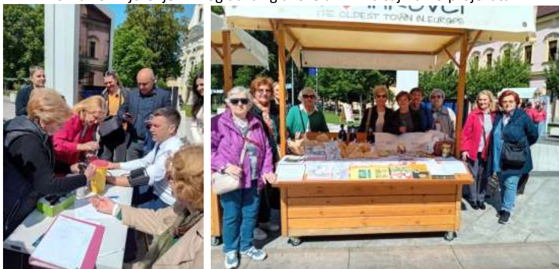
Slika 25: Mjerenje krvnog tlaka i glukoze u krvi na sajmu EU projekata

Sajam EU projekata za Društvo „Hrvatska žena“ Vinkovci je idealna prilika da se sugrađanima predstavi dosadašnji rad, ali i najave buduće investicije i kreiraju novi projekti koji će privući nove vrijednosti i doprinijeti razvoju Društva i naše lokalne zajednice.