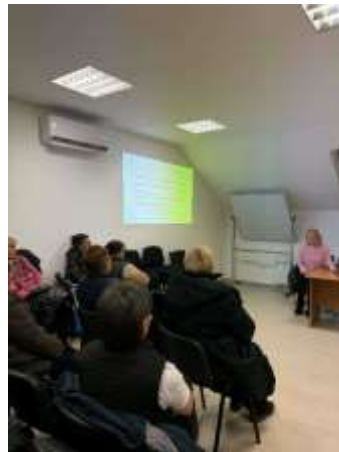
Slika 5. Edukacija volontera u palijativi Općina Nuštar