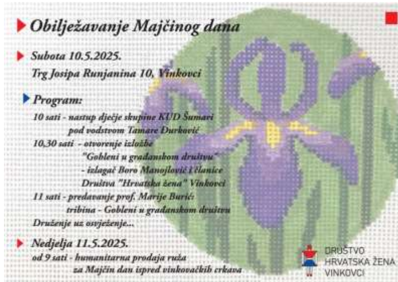
Slika 16 : Letak za Majčin dan

Vesela i kreativna likovna radionica za djecu, u povodu Majčinog dana, održana je 3. svibnja 2025. godine u lapidariju Gradskog muzeja Vinkovci, gdje je 50 djece sudjelovalo u oslikavanju šalica i crtanju i bojanju čestitki za svoje majke. Svoje šalice su nakon pečenja i glaziranja ponijeli kućama.