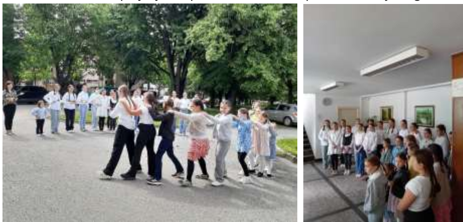
Slika 17: Nastup dječje skupine KUD-a Šumari povodom Majčinog dana