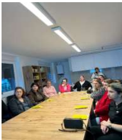
Slika 4. Edukacija neformalnih njegovatelja U domu za stare Ilok

Edukacijom za volontere u palijativnoj skrbi, realiziranoj u općini Nuštar u vremenu od 24.11.2025. do 2.12.2025. godine, educirano je 19 osoba. Svaki polaznik-volonter dobio je Potvrdu o završenoj edukaciji.