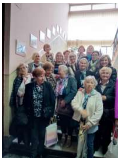
Slika 26 : Sudjelovanje članica Društva „Hrvatska žena“ Vinkovci na Saboru „Hrvatske žene“ u Novom Travniku

Crkva je bila srušena u ožujku 1993. godine, a obnovljena 1995. godine. Obnovom joj se vraća izgled iz 1910. godine, i zadržava poštovanje u srcima vjernika. Dogradnja crkve, kojoj jedan zid čini stijena, a sa starom crkvom i vanjskim oltarom čini kompleks svetišta.