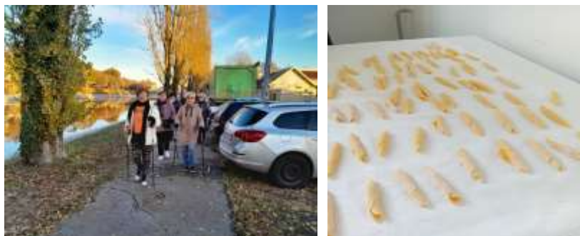
Izvor: Društvo Hrvatska žena Vinkovci

U okviru rada Centra za starije osobe, Društvo aktivno sudjeluje u pripremi i provedbi projekata, prijavom na javne pozive i natječajne jedinica lokalne i regionalne samouprave, natječajne nacionalnih programa javnih tijela vlasti i EU fondove.