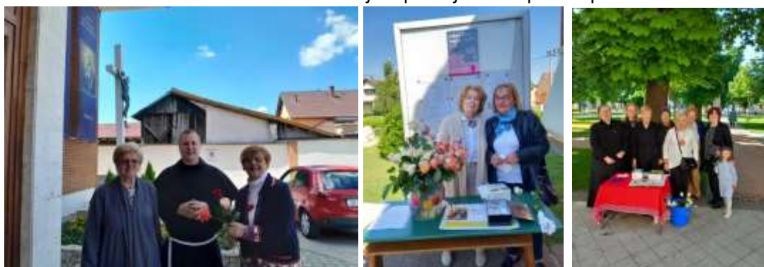
Slika 20: Donacijska prodaja ruža ispred župnih crkava

U nedjelju 11. svibnja 2025. godine, članice Društva i vanjski članovi su pred župnim crkvama, već tradicionalno, organizirale donacijsku prodaju ruža, čija prikupljena sredstva idu za održavanje stana u kojem borave maligno i teško oboljela djeca s roditeljima za vrijeme aktivnog liječenja u zagrebačkim klinikama.