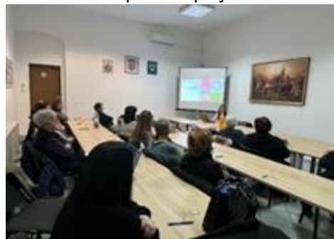
Slika 6. Edukacija volontera u palijativi Općina Trpinja