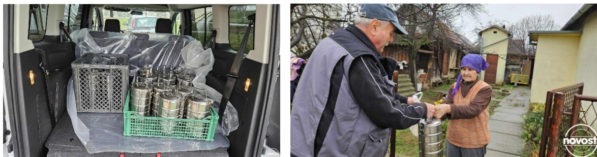
Slika 8. Pilot projekt besplatne dostave obroka najpotrebitijim osobama u Vinkovcima

Pilot projekt besplatne dostave obroka najpotrebitijim osobama financira Grad Vinkovci.