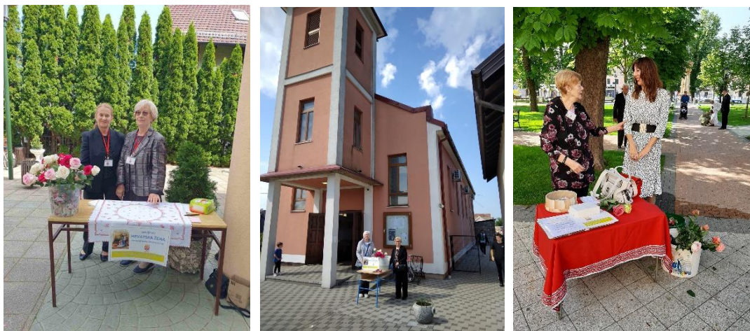
Slika 18. Donacijska prodaja ruža za Majčin dan

U nedjelju 12. svibnja 2024. na Majčin dan, članice/volonterke i vanjski volonteri su ispred župnih crkava u Vinkovcima održale donacijsku prodaju ruža. Društvo „Hrvatska žena“ Vinkovci ovu akciju održava već dugi niz godina, a sva donirana sredstva se uplaćuju za održavanje stana u Zagrebu u kojem borave maligno i teško oboljela djeca i njihovi roditelji, pogođeni siromaštvom, za vrijeme aktivnog liječenja u zagrebačkim klinikama.