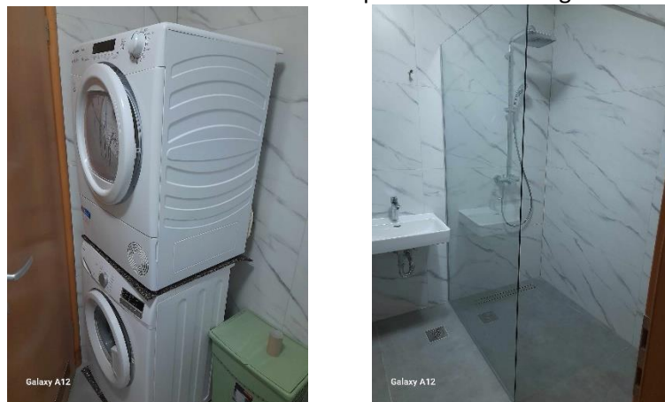
Slika 1. Renovirana kupaonica stana u Zagrebu

U svrhu uređenja i opremanja stana tijekom 2024. godine Društvo je prikupilo 8.650,00 eura od pravnih i fizičkih osoba. Društvo je od primljenih donacija kupilo sušilicu rublja i opremilo stan sa potrebitim (deke, ručnici, kuhinjske krpe, kutije za odlaganje rublja, ormariće i police u kupaonici). Kupaonica je u 2024. godini renovirana od strane privatnog poduzetnika iz Zagreba čime je osiguran bolji pristup osobama sa invaliditetom.