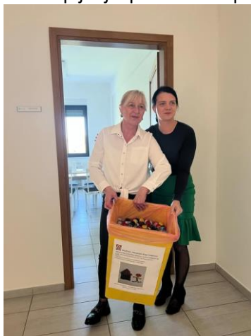
Slika 9. Prikupljanje plastičnih čepova

Humanitarno - karitativna akcija „Kućica Dobrote“, kojom se kroz prikupljanje plastičnih čepova prikuplja pomoć za potrebite i rad Društva, provodila se i u 2024. godinu, te je prikupljeno preko 1 tone plastičnih čepova. Društvo akciju provodi u suradnji s trgovinama „Boso“ gdje se predaju prikupljeni čepovi koji se odvoze u „Drava International“ Osijek s kojim Društvo ima potpisan Ugovor o donaciji. U akciju su se, uz članice Društva, uključili i jedna srednja škola, „Hrvatske šume“ d.o.o. Vinkovci, pojedini građani i Grad Vinkovci. Ova humanitarno-karitativna akcija svakako pridonosi povećanju svijesti šire javnosti o koristima razdvojenog sakupljanja otpada u zaštiti okoliša.