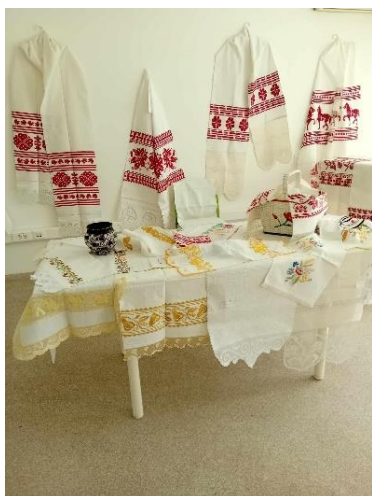
Slika 11. Izložba svatovskih otaraka i uskrasnih otarčića