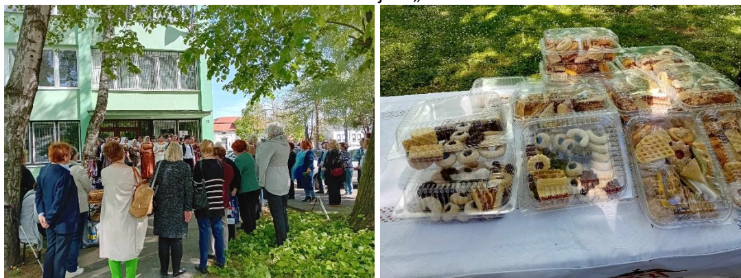
Slika 10. Projekt „Kultura u kvartu“

Projektom su predstavljeni i drugi elementi tradicijske baštine povezani uz svatovske običaje kao što je izrada suhih svatovskih kolača.