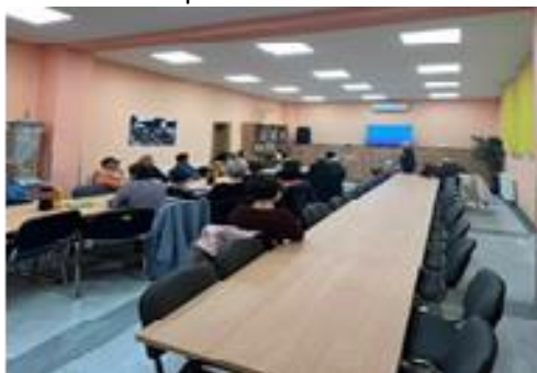
Slika 5. Edukacija volontera u palijativi Općina Ivankovo

Cilj edukacije je poboljšanje kvalitete života osoba u palijativnoj skrbi kroz aktivnosti usmjerene na poboljšanje informiranosti i dostupnosti usluga potpore osobama kojima je potrebna palijativna skrb. Teme edukacije bile su: dostupne usluge palijativne skrbi, psihološka podrška, žalovanje, uloga socijalnog radnika u palijativnoj skrbi. Svaki polaznik-volonter je dobio je Potvrdu o završenoj edukaciji.