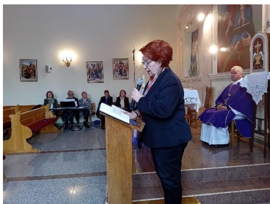
Slika 22. Duhovna obnova članica Društva „Hrvatska žena“ Vinkovci

Godinama Društvo „Hrvatska žena“ Vinkovci, temeljem svog programa rada, u korizmi organizira duhovnu obnovu. Tako se 16. ožujka 2024. godine, dvadesetak članica okupilo u Marijinom domu. Sestre Služavke malog Isusa su pridošlim članicama zaželjele dobrodošlicu, a onda su nakon mogućnosti ispovijedi, u kapelici Male Gospe slijedili sveta misa i križni put. Duhovnik ove godine je bio pater Ilija Sudar, župnik župe sv. Vinka Pallottija u Vinkovcima. Pjevačka grupa Društva je uveličala svetu misu pjevanjem. Nakon svete mise uslijedio je „Marijanski križni put“, koji su uz križ i svijeće, molile članice Društva.