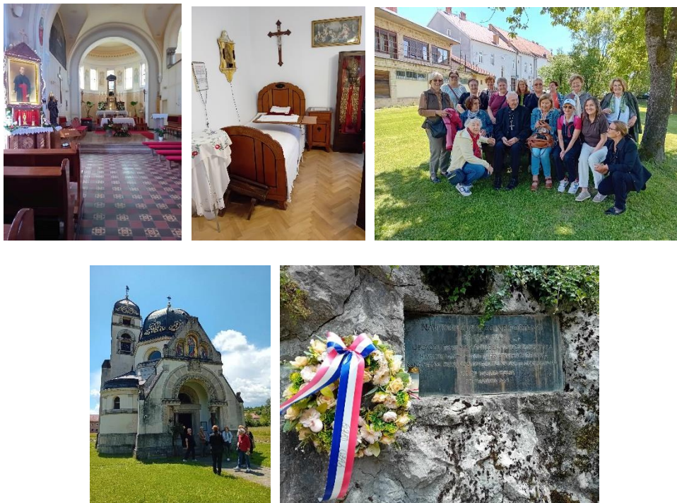
Slika 23. Hodočašće U Krašić, Strmac Pribički i Ozalj

biskupa sa dvorom iz 1752. godine., u čijem je parku crkva Blagovijesti. Posjet se nastavio u starom gradu Ozlju, na rijeci Kupi. Ozalj je poznat kao rodno mjesto slikarice Slave Raškaj koja je slikala akvarele, pejzaže i motive Ozlja i Kupe.