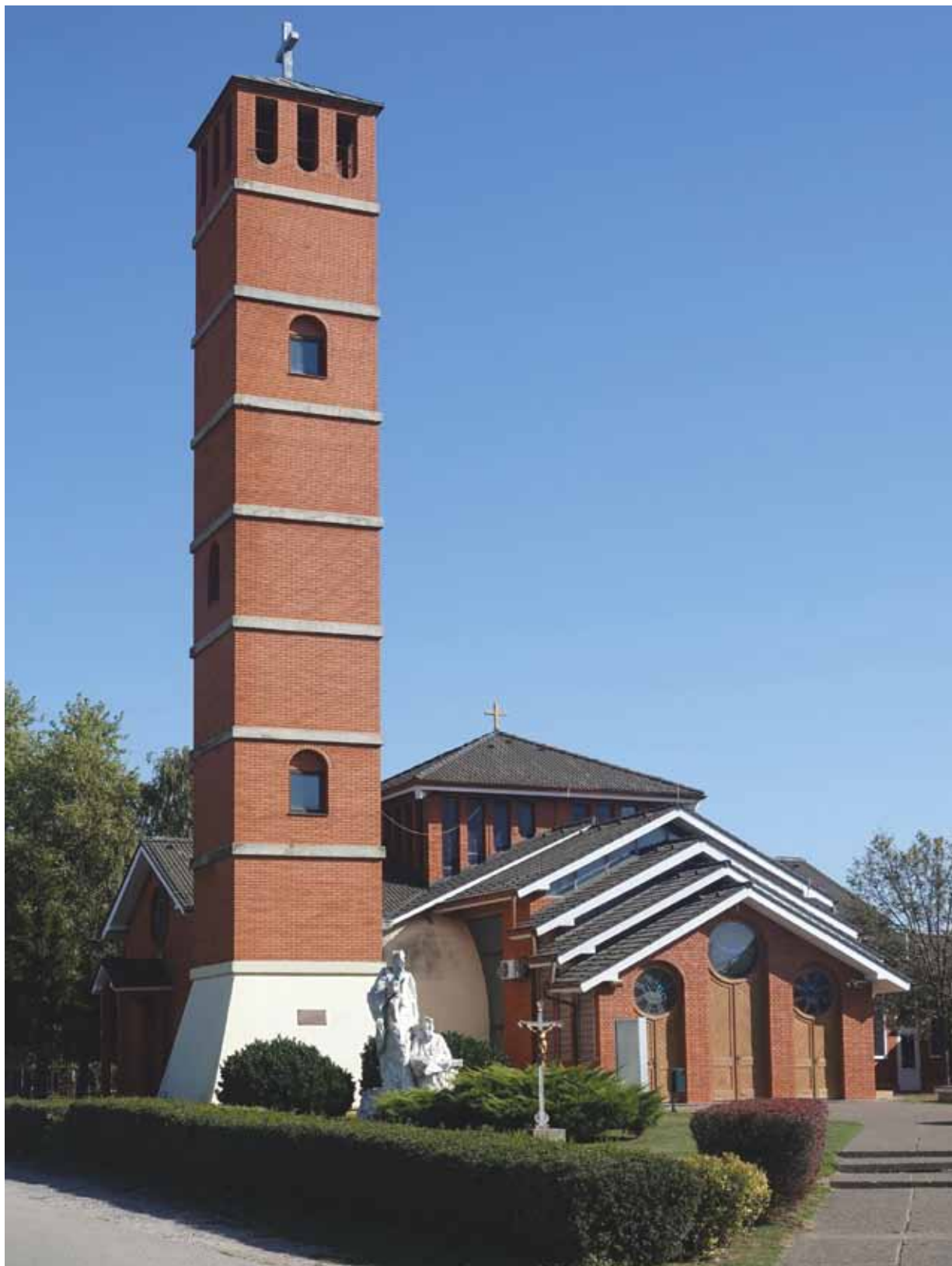
crkva sv. Ćirila i Metoda, Vinkovci