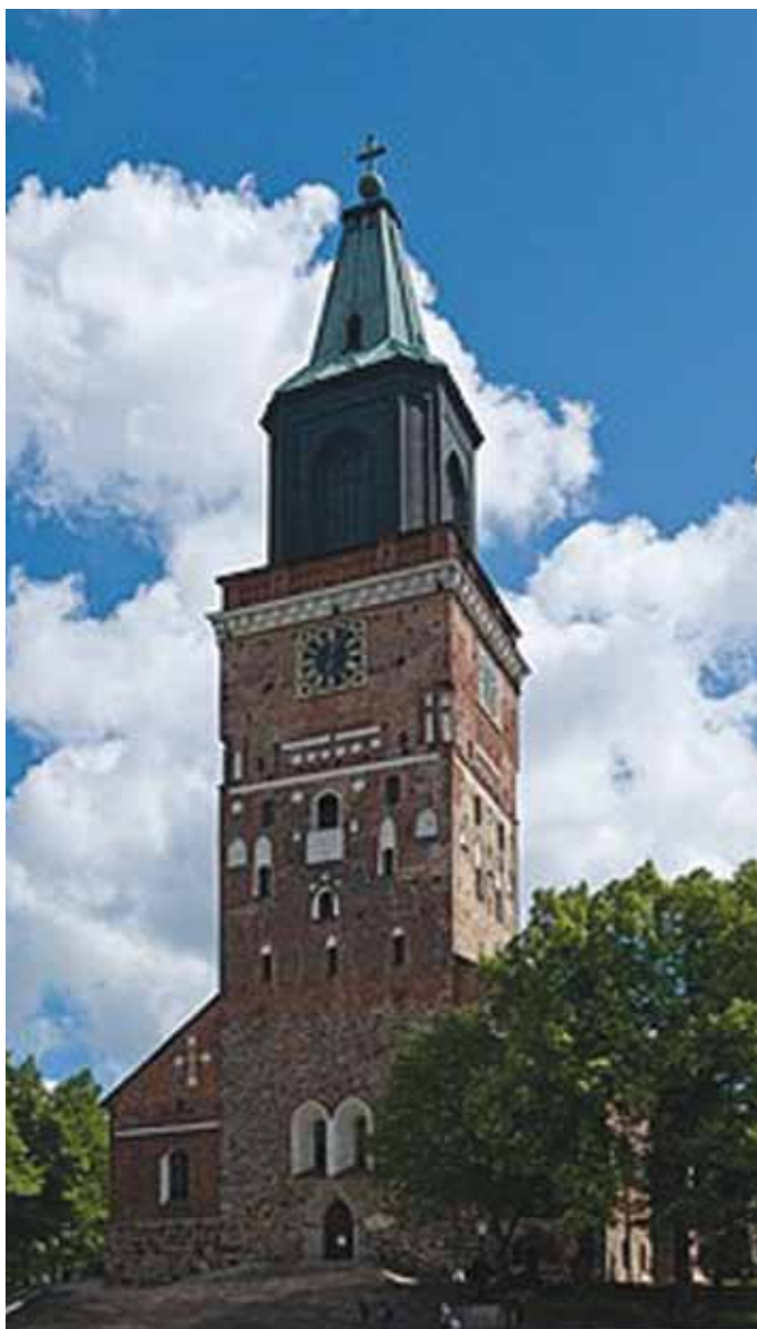
Katedrala u Turku

spreмно do Badnjaka. Kada u 12 sati zazvone zvona s katedrale u Turku, vrijeme je za objavu Božićnog mira. To je tradicija koja se njeguje od 13. stoljeća. Danas se prenosi putem TV-a i radija i mnogi Finci prate taj program. Počinje proslava Božića. U Finskoj se najvažnija proslava održava na Badnjak. Obavezno se ide u crkvu i na groblje, pale se svijeće i moli za članove obitelji koji više nisu s nama.