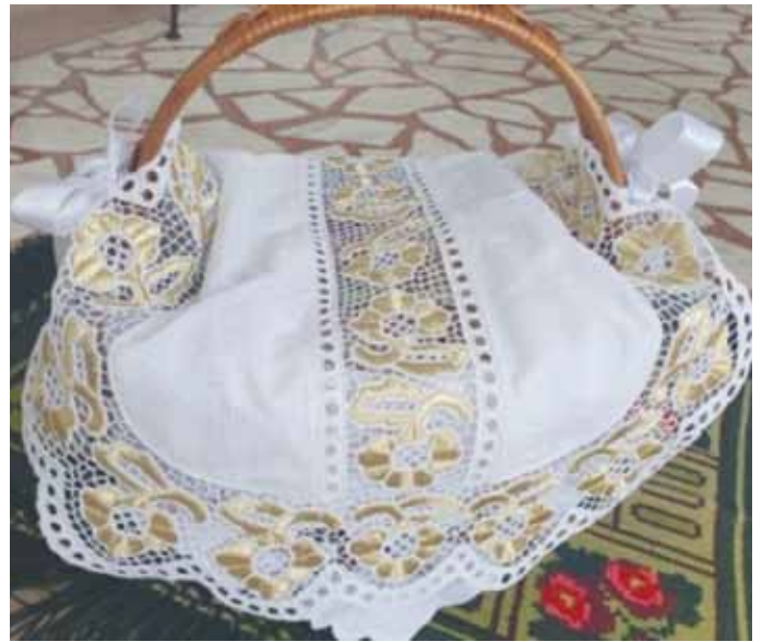
III. mjesto: Uskrsna košarica Željke Vulić, Vinkovci, 2021.

Svih 17 sudionika ovoga fotografskog natječaja na uskrsnu temu dobili su priznanja i publikaciju DHŽVk Kruh naš svagdašnji koje su im uručile članice ocjenjivačkog Povjerenstva: Marija Mišetić, Katica Šarčević i Ljubica Potočić. Nagrađenima su uručeni buketi cvijeća, a prvonagrađenim i likovno djelo. Ovaj svečani program na kreativan način moderirala je članica Društva HŽVk Milka Vida. Čestitke svim sudionicima natječaja fotografije Uskrsne košarice 2021. godine!