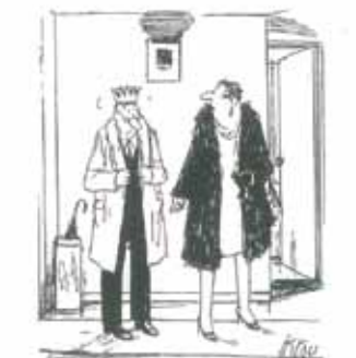
Novogodišnja zabava je završila. Sada možeš abdicirati!