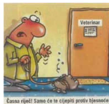
Časna riječ! Samo će te cijepiti protiv bjesnoće.