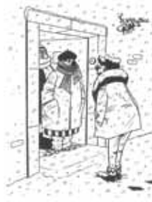
Izlazite? Ne, baš smo krenuli na spavanje.